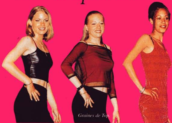
Graines de Top.

A la fin du mois d'avril, Laurent Boyer, animateur vedette sur M6 et toute son équipe se sont installés à Pontault-Combault pour le grand casting officiel de «Graines de star», une émission qui a révélé les nouveaux artistes du moment comme Alizée, Cécilia Cara, Eve Angéli et bien d'autres. Sous l'égide de la Direction des Affaires culturelles, 150 jeunes de Pontault-Combault et des villes environnantes ont postulé avec enthousiasme au précasting organisé salle Jacques-Brel, le dimanche 28 avril. Un concept qui connaît déjà le succès en province et qui s'est déplacé pour la première fois en région parisienne. Les candidats sélectionnés ont pu prendre possession de la scène et goûter aux joies d'une prestation en public. Une soirée exceptionnelle, mardi 30 avril avec une salle comble et une ambiance chaude et électrisée par un jeune public enthousiaste et débordant de vitalité.